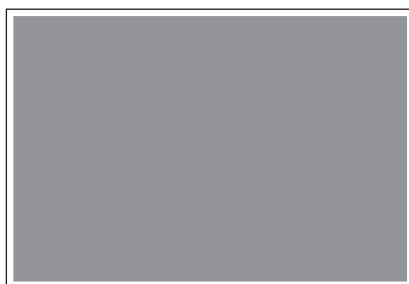
Doppia interna o 1a romana+2a di copertina 460x295 mm+ 5 mm

*per richieste fuori standard o per inserimenti di inserti i nostri commerciali sono a vostra disposizione