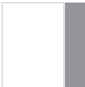
Allungo di copertina 110x260 mm